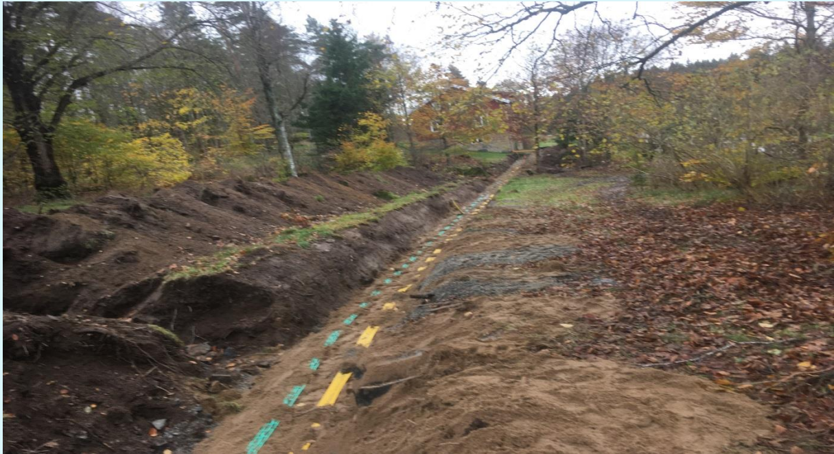
Bilden visar schaktning för fiber.